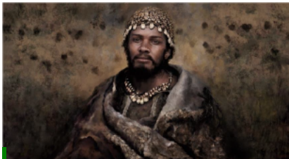
Reconstruction of a hunter-gatherer associated with the Gravettian culture (32,000-24,000 years ago), inspired by the archaeological findings at the Arene Candide site (Italy). ©Tom Bjoerklund

L'équipe a analysé les génomes de 356 chasseurs-cueilleurs préhistoriques de différentes cultures archéologiques – y compris des données inédites issues de 116 individus provenant de 14 pays différents d'Europe et d'Asie centrale. Il avait déjà été mis en évidence que des populations d' Homo sapiens ont commencé à se répandre en Eurasie il y a environ 45 000 ans, mais que ces premières vagues de peuplement n'ont pas contribué à la diversité génétique des populations présentes en Europe par la suite. La nouvelle étude se concentre sur les individus qui vivaient il y a entre 35 000 et 5 000 ans et qui sont eux, au moins en partie, les ancêtres des populations qui vivent aujourd'hui en Eurasie occidentale. En outre, elle décrit – pour la première fois – les génomes des individus qui ont vécu pendant le Dernier Maximum Glaciaire, la phase la plus froide de la dernière période glaciaire, il y a environ 25 000 ans.