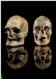
Oldest evidence of migration during a climate warming: Male and female skull buried in western Germany